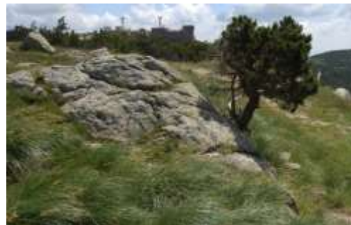
Autre exemple d'affleurement rocheux