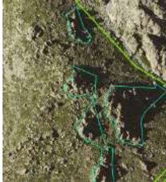
Affleurements rocheux (numérisés en bleu) Les éléments < 10 ares ne sont pas numérisés dans une prairie permanente