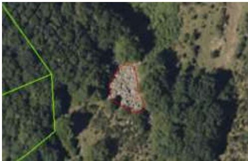
L'affleurement rocheux est saisi au plus proche de l'emprise au sol