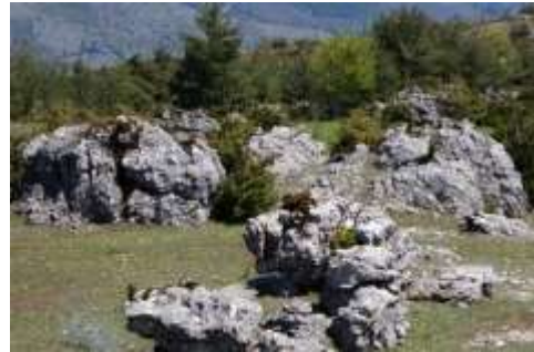
Exemple d'affleurement rocheux